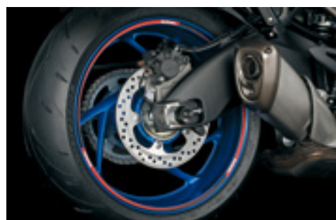
Naklejki ozdobne obręczy koła 990D0-WHL02-RD1 Czerwono – czarne z logo Suzuki. Zestaw na 1 koło.