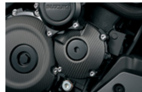
Karbonowa pokrywa rozrusznika 990D0-04K26-CRB Matowe wykończenie.