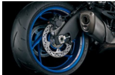
Naklejki ozdobne obręczy koła 99182-48K00-WHT Z logo GSX-S1000GT. Zestaw na 1 koło.