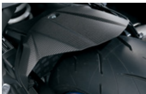
Karbonowy błotnik tylny 990D0-04K80-CRB Matowe wykończenie.