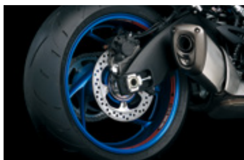
Naklejki ozdobne obręczy koła 99182-48K10-RED Z logo GSX-S na wewnętrznej powierzchni felgi. Zestaw na 1 koło.