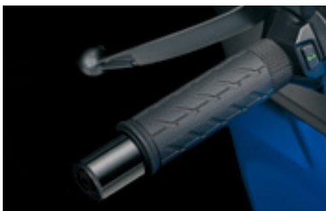
Podgrzewane manetki 57100-48822-000 Dzięki trójstopniowej regulacji, manetki sprawią, że dłonie pozostaną ciepłe bez względu na długość pokonywanej trasy.