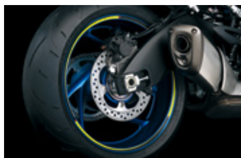
Naklejki ozdobne obręczy koła 99183-48K00-YEL Żółte z logo S. Zestaw na 1 koło.