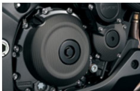
Karbonowa pokrywa sprzęgła 990D0-04K25-CRB Matowe wykończenie.