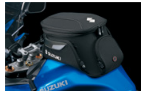
Sakwa na zbiornik paliwa – duża 990D0-04600-000 Wytrzymała tkanina nylonowa z elementami odblaskowymi. Regulowana pojemność 11 do 15 litrów; w zestawie pokrowiec przeciwdeszczowy oraz pas naramienny.

Maks. obciążenie: 2,5 kg. Maks. prędkość jazdy: 130 km/h. Wymagany montaż pierścienia - 99148-00A20-000