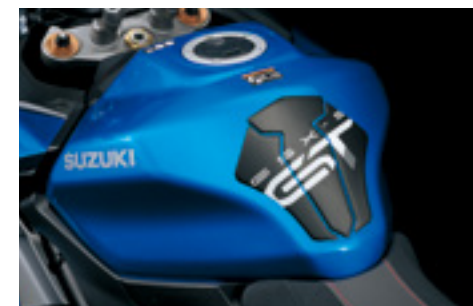
Folia ochronna zbiornika paliwa 99180-48K00-BLK Naklejka ochronna na zbiornik paliwa, chroniąca lakier przed zarysowaniami. Zestaw na prawą i lewą stronę. Z logo GSX-S GT.