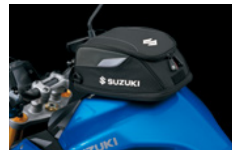
Sakwa na zbiornik paliwa – mała 990D0-04300-000 Wytrzymała tkanina nylonowa z odblaskowymi lamówkami. Regulowana pojemność 5 do 9 litrów; w zestawie pokrowiec przeciwdeszczowy oraz pas naramienny.

Maks. obciążenie: 2,5 kg. Maks. prędkość jazdy: 130 km/h. Wymagany montaż pierścienia - 99148-00A20-000