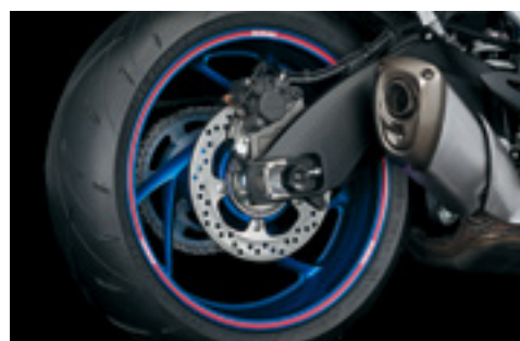
Naklejki ozdobne obręczy koła 990D0-WHL03-RD1 Czerwone z logo Suzuki. Zestaw na 1 koło.