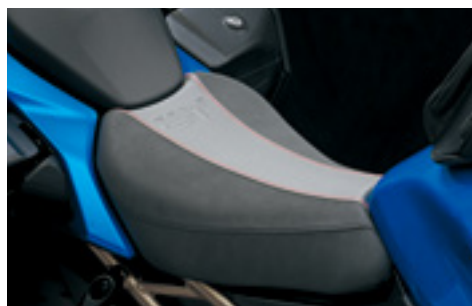
Siedzisko kierowcy 45100-48K60-B8V Z logo GSX-S GT.