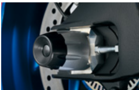
Ślizgi ochronne osi tylnej 99116-48K00-000 Nakładki ochronne na tylną oś. Ochrona przed uszkodzeniami przy upadku.