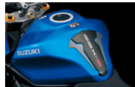
Tankpad 99180-48K10-GRY Ochrona przez zarysowaniami. Logo „GSX-S”.