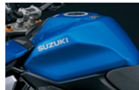
Folia ochronna zbiornika paliwa 99181-48K00-000 Przezroczysta naklejka ochronna na zbiornik paliwa, chroniąca lakier przed zarysowaniami. Zestaw na prawą i lewą stronę.