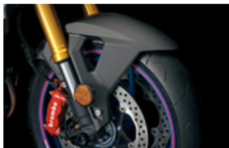
Karbonowy błotnik przedni 99130-48K00-CRB Matowe wykończenie.