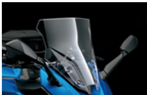
Szyba turystyczna 94600-48890-000 Znacząco redukuje nacisk wywoływany pędem powietrza na górną część ciała i głowę kierowcy. Wyższa o 77 mm od wersji standardowej.