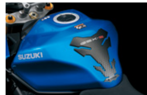
Tankpad 99180-48K20-BLK Ochrona przez zarysowaniami. Logo „GSX-S”.