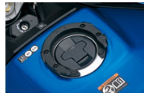
Pierścień mocowania sakwy 99148-00A20-000 Niezbędny do mocowania na zbiorniku paliwa sakwy dużej (990D0-04600-000) lub małej (990D0-04300-000).

Maks. obciążenie: 2,5 kg. Maks. prędkość jazdy: 130 km/h. Wymagany montaż pierścienia - 99148-00A20-000