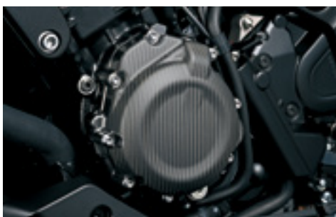
Karbonowa pokrywa alternatora 990D0-04K20-CRB Matowe wykończenie.