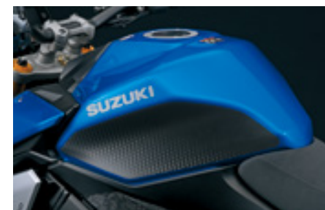
Folia ochronna zbiornika paliwa 99181-48K10-BLK Czarna naklejka ochronna na zbiornik paliwa, chroniąca lakier przed zarysowaniami. Zestaw na prawą i lewą stronę.