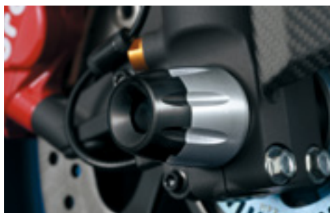
Ślizgi ochronne osi przedniej 990D0-07L16-000 Nakładki ochronne na przednią oś. Ochrona przed uszkodzeniami przy upadku.